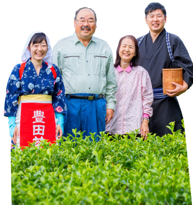
海外の取引先からはいしかわ製茶の小さな家族経営が評価されている