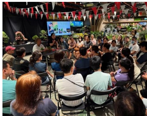
シンガポールでのイベント風景