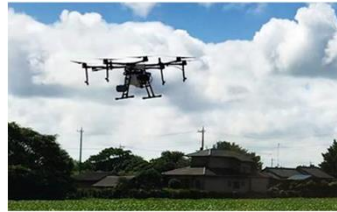
ドローンによる スポット散布

土壌分析やドローンを活用した化学肥料・化学農薬の低減、バイオ炭の農地への投入技術 など