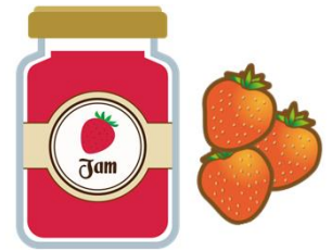
規格外農産物 を使った商品開発