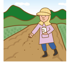
バイオ炭施用による 炭素貯留