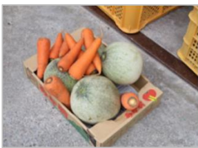
規格外野菜の活用