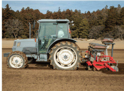
野菜用畝立同時局所施肥機