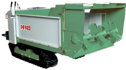
マニュアルスプレッダー