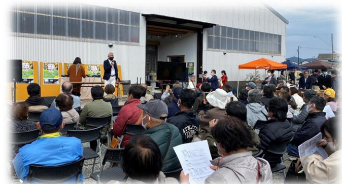
地域が一体となった有機農業イベントの開催