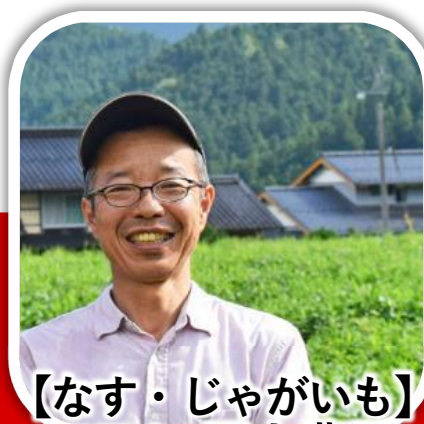
【なす・じゃがいも】