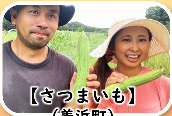
【さつまいも】 (美浜町)