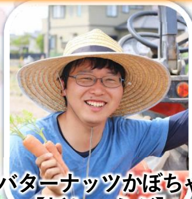
【バターナッツかぼちゃ】 【新しょうが】 江南市 四季こもごも