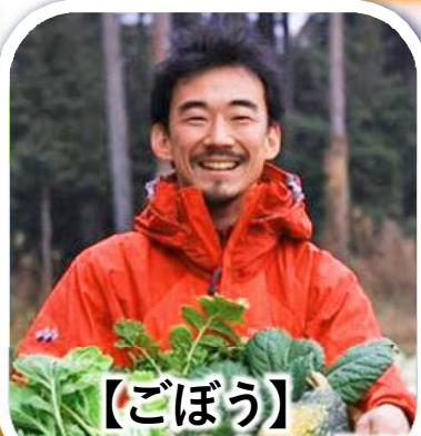
【ごぼう】 いなべ市 ゆたか農園 (朝市村)