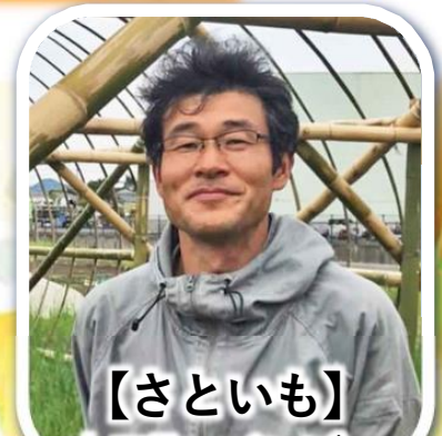
【さといも】 大口町 バンブー オーガニックファーム

※これらの野菜は、大名古屋ビルヂング5階スカイガーデンで開催される「天空のオーガニックマーケット」を中心に調達しています。