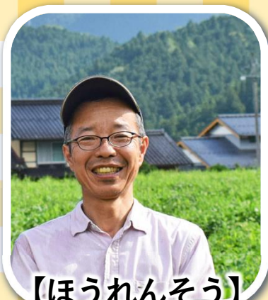
【ほうれんそう】 下呂市 田上農園