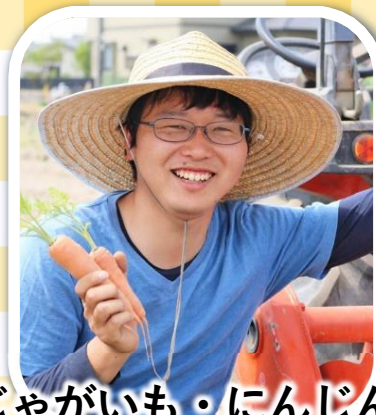
【じゃがいも・にんじん】 江南市 四季こもごも