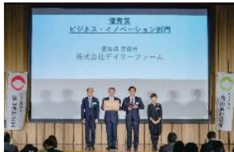
株式会社デリーファーム