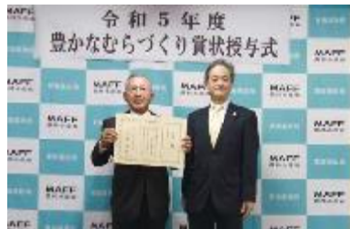
堀川代表理事(左)、森局長(右)