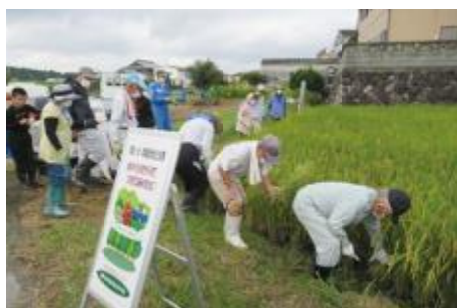
三世交代流水田での稲刈り