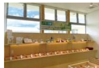
Cotti菜の県内ノウフク商品 販売コーナー