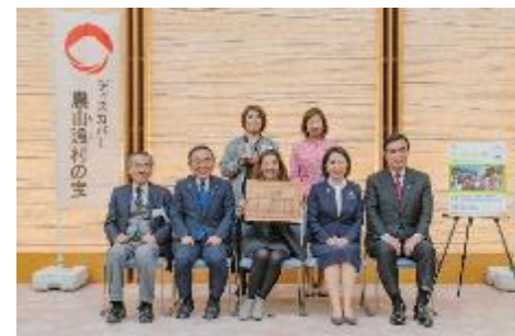
株式会社七転八倒