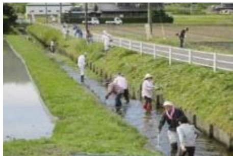
クリーン作戦(草刈りと水路の清掃)