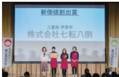
株式会社七転八倒