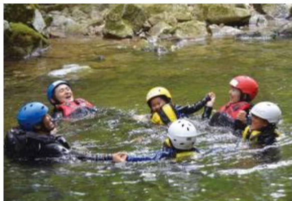
白川町の美しい自然を満喫するアクティビティ