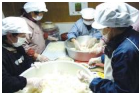
女性グループによる味噌作り