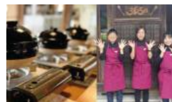
雇用とコミュニティの核となる「古民家カフェ365nichi」

問合せ先 〒518-1425 三重県伊賀市川北604番地 TEL 0595-51-7358 MAIL info@shichiten-battou.com