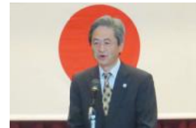
東海農政局 森局長あいさつ