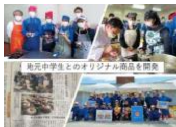
地元中学生とオリジナル商品を開発

問合せ先 〒479-0806 愛知県常滑市大谷字芦狭間5番地 TEL 0569-37-0072 MAIL a.ichita@dailyfarm.co.jp