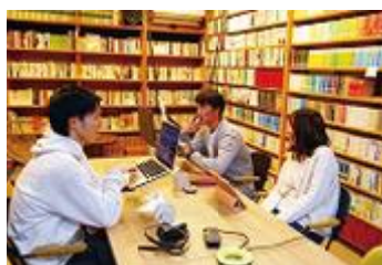
ニーズを活かしたワーク環境を整備