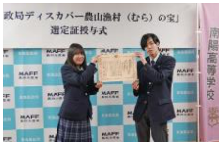
愛知県立南陽高等学校の生徒代表