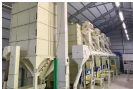
新たに整備したミニライスセンター