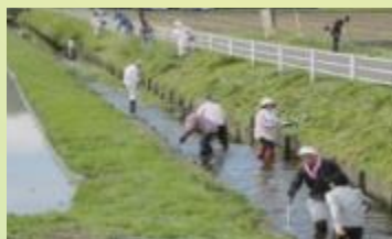
東海農政局長賞受賞 梅原地域ふる里活性化協議会