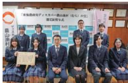
愛知県立南陽高等学校の皆さんと野中地方参事官（前列左から3人目）