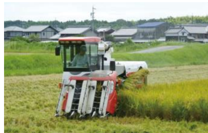
地域の担い手として活動

今後の展開 高齢化が進み若手後継者の育成が必要であり、2～3年後を目途に複数の若手を後継者として育成する。農業所得の向上のため、栽培技術の改善による品質や収量の向上や、新技術・新品目の導入に積極的に取り組む。これらにより、地域の農業、住民が生き生きと暮らせる地域づくりを持続的に進める。