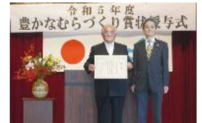
谷村代表(左)、森局長(右)