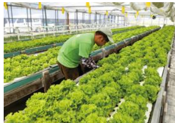
農作業施設「わか菜の杜」で作業する障がい者の方