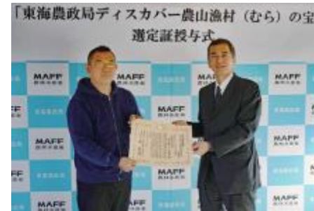
辻代表取締役（左）と 遠山東海農政局次長（右）