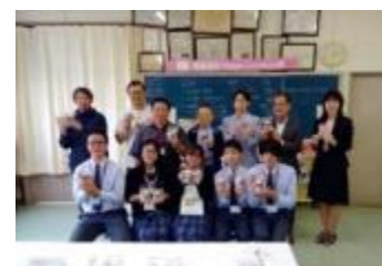
規格外野菜の有効活用の検討