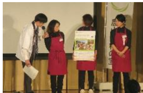
青木源太アナウンサーからのインタビュー