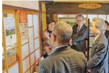
農泊施設「里山ゲストハウス 晴耕雨読とみだ」について説明する関係者