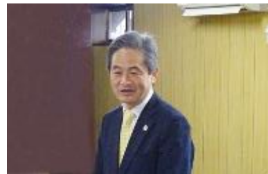
東海農政局 森局長あいさつ