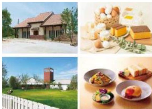
6次化施設「ココテラス」(上)と農家レストラン「レシビラ」(下)