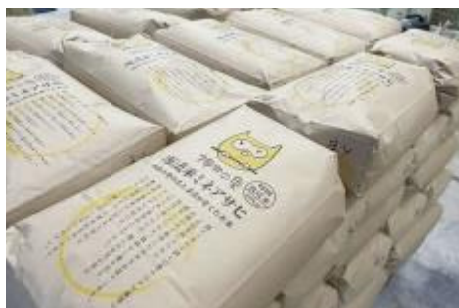
特別栽培米ミネアサヒ