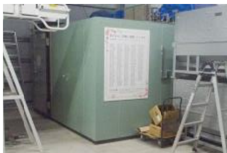
クラウドファンディングにより整備した穀物保冷库(みんなの蔵)