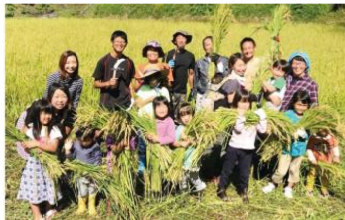
「自給家族」の収穫イベント