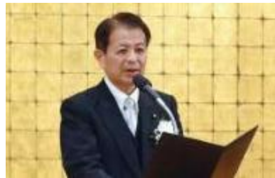
宮下農林水産大臣あいさつ