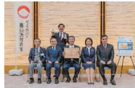
株式会社デリーファーム