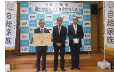
左から鈴木代表理事、森局長、後藤理事