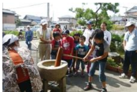
北小松長寿会の指導による餅つき