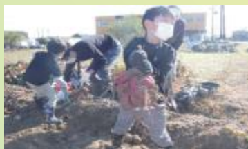
東海農政局長賞受賞 農事組合法人キタコマツファーム