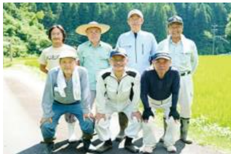
押井営農組合の中心メンバー