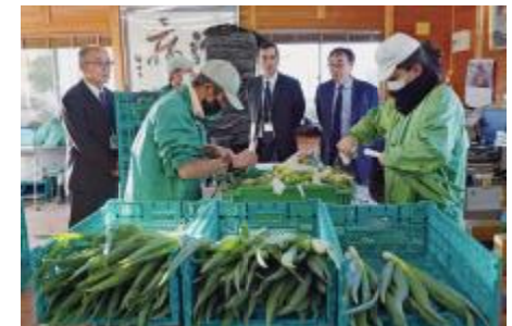
農作業施設「わか菜の杜」の出荷調整作業の様子