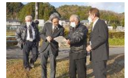
現地視察の様子(ホテルの生態系保全活動)