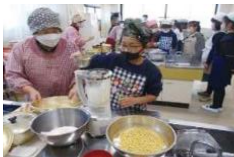
食農教育(豆腐作り)