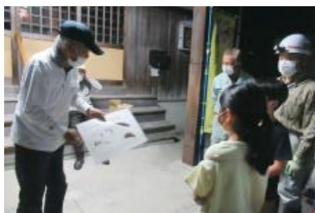
ゲンジホテル観察会