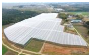
7.3haを集積し、園地を造成