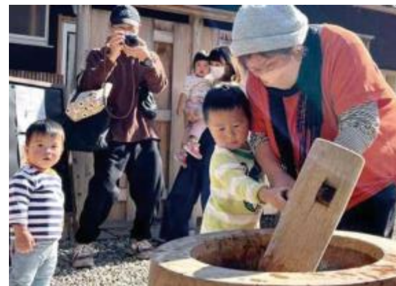
都会と田舎の交流を生む四季折々のイベント