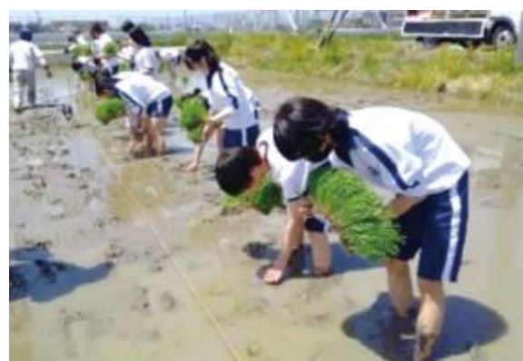
硫黄コーティング肥料を使用した米作り