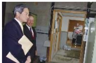
現地視察の様子(古民家を改修したみそ製造施設)