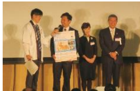
青木源太アナウンサーからのインタビュー