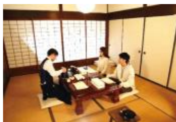
町特産の白川茶の 歴史・魅力を味わう体験