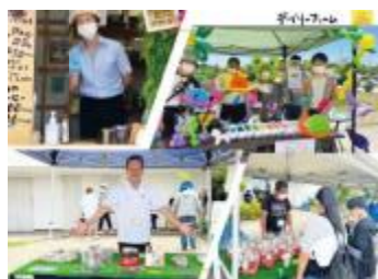
直売施設にて地元のお店や農家とマルシェを開催