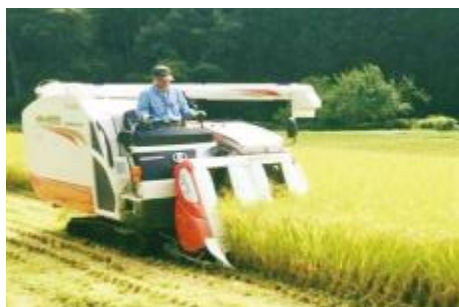
共同化に向け購入した4条刈りコンバイン