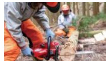
山を守る地元講師による週末田舎人の育成