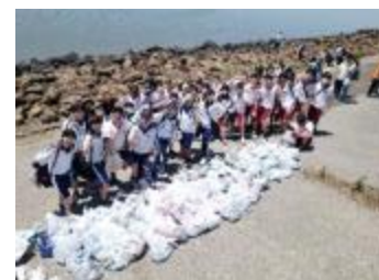
藤前干潟クリーン大作戦