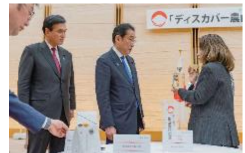
岸田総理との歓談