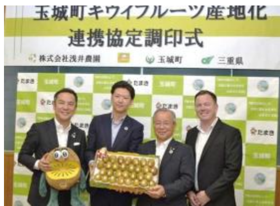
玉城町とのキウイフルーツ産地化連携協定