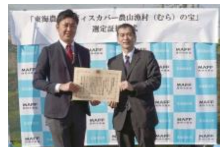
浅井専務取締役（左）と 遠山東海農政局次長（右）