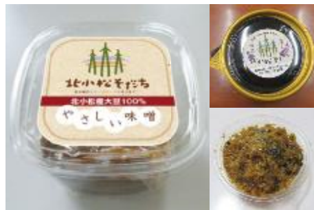
女性グループが開発した味噌、なす麴煮