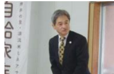
東海農政局 森局長あいさつ