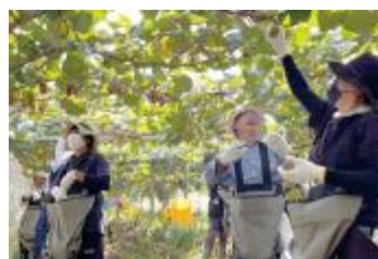
キウイフルーツの収穫

問合せ先 〒514-2221 三重県津市高野尾町4951 TEL 059-230-1212 MAIL info@asainursery.com