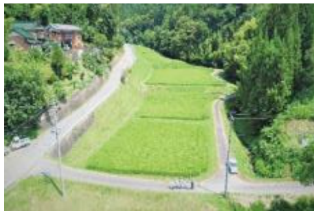
押井町の水田風景