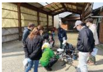
オフシーズンの トラブル事例共有勉強会