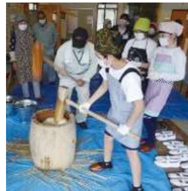
食農教育(稲刈り、餅つき)