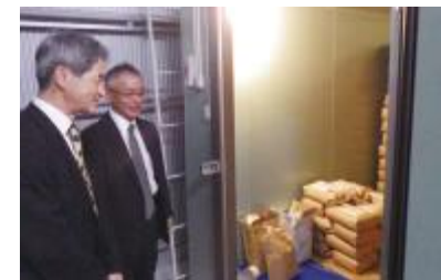
現地視察の様子(穀物保冷庫(みんなの蔵))