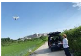
リモートセンシングドローン