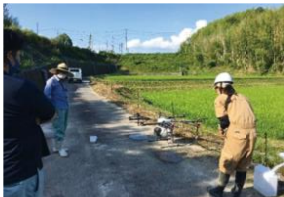
ドローンを活用した散布作業と地域生産者への作業説明