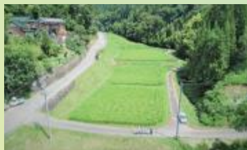
日本農林漁業振興会会長賞 農林水産大臣賞受賞 一般社団法人押井宮農組合