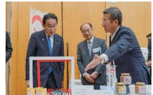
岸田総理との歓談