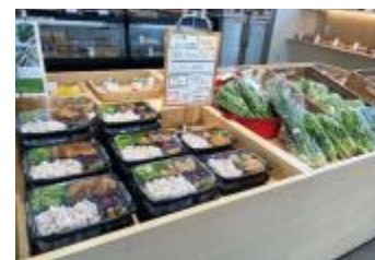
カフェ「Cotti菜」での 弁当や野菜の販売