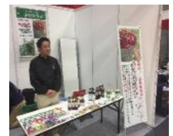
【都市部での食品展示会】