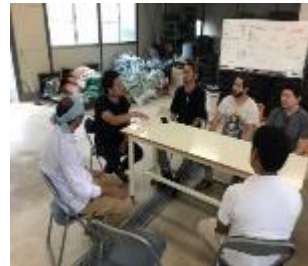
【専門家による意見交換】