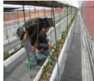
【水分調整による栽培】