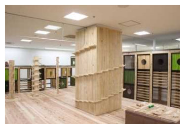
【市内施設コーディネート事例】