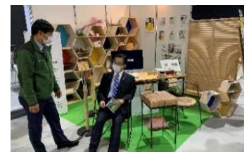
【展示会出展の様子】