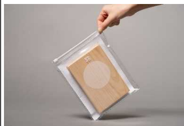
【開発した御朱印帳】