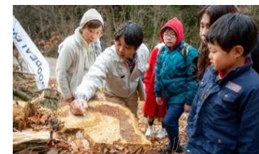
【森林ツアーのようす】