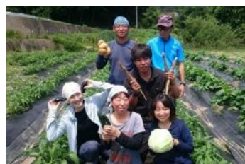
H13の移住・就農者とその従業員