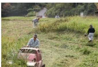
たなだ維持・管理組合の作業風景