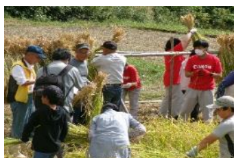
小学校や企業と連携した棚田学校