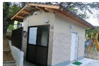
広場に整備した多目的公衆トイレ