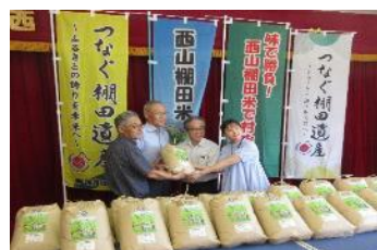
福祉協議会へ棚田米を寄付