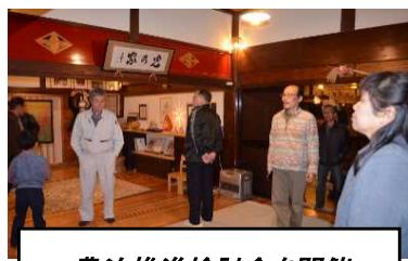
農泊推進検討会を開催