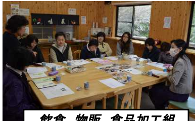
飲食、物販、食品加工組織と課題発見の協議