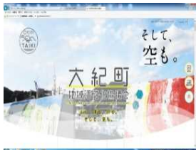
多言語に対応した本格的なホームページの作成。