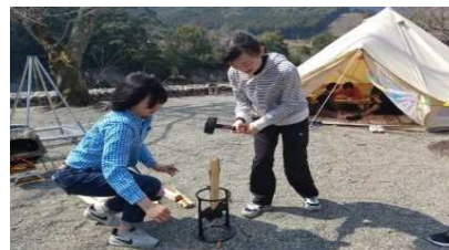
新体験プログラム開発事業・林業体験&デングランピングモニターツアー