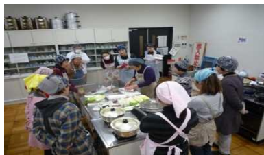
「食」のメニュー開発事業・郷土料理「へか煮」料理講習会の開催