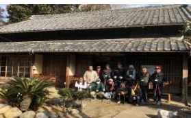
古民家を活用した「民泊東作塾」の開業支援