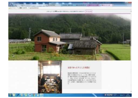
「伊勢路むかしの暮らし体験の宿」事業支援ホームページの作成