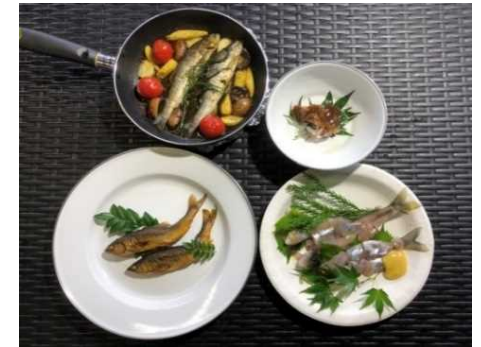
アユ料理メニュー開発