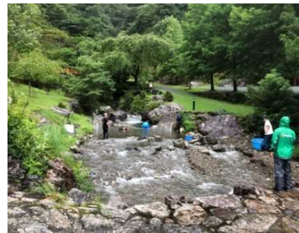
アユツーリズム「伝統漁法アユのしゃくり体験」×「アユの郷土料理」