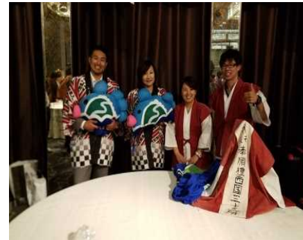
台湾大商談会(関西観光本部主催)