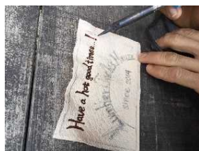
レーザークラフト