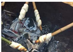
竹まきまきパンづくり