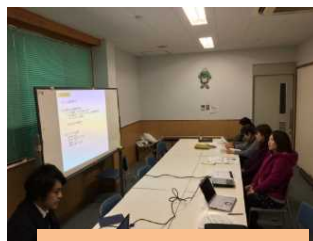
WEBプロモーション講義