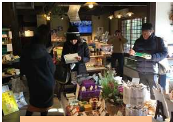
意向調査の実施状況