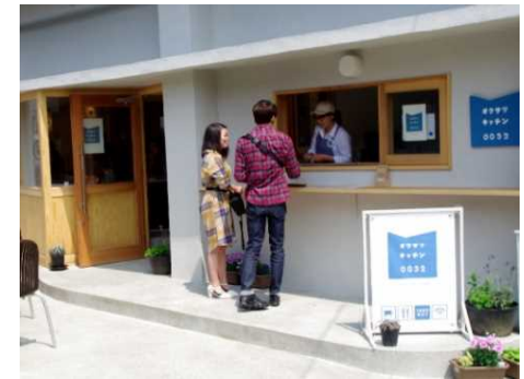
施設整備事業で空き屋を店舗に改修 オウサツキッチン0032完成