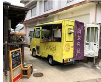
マーケティングのためのキッチン カーでのテスト販売でニーズ調査