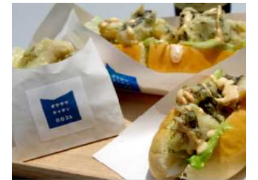
地元食材を活用した郷土料理の試作や専門家活用によるメニュー開発