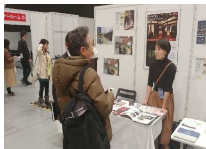
ロングステイフェア(@東京国際フォーラム)に出展