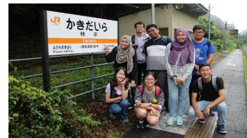
外国人留学生を対象としたモニターツアー陶芸体験後の集合写真