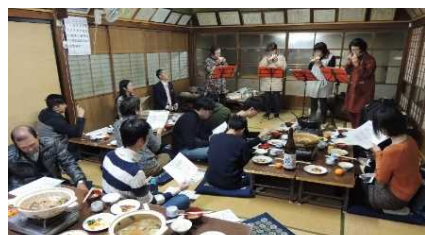
外国人留学生を対象としたモニターツアー①村の住人と参加留学生の交流の様子