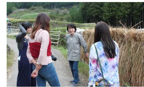
農泊の外部発信、誘客の可能性を探るメディア招聘ツアーを開催