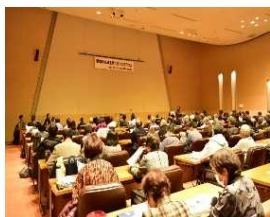
農泊推進研修会を開催。約120名の参加。