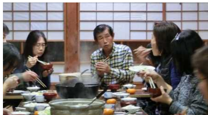
日本人対象のモニターツアー② 食事を共にしながら限界集落の将来や農泊の需要について話す