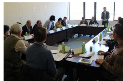
「奥三河田舎暮らし推進協議会」の設立総会