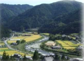
里山ミュージアム