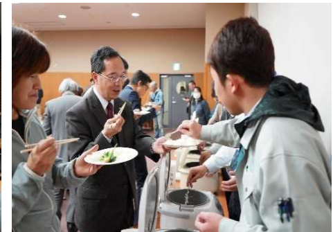
2019.2.4_中間報告セミナー 有機農法による地元ブランド米の試食