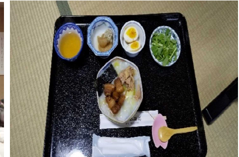
2019.3.23_最終報告セミナー 泊食分離を見据えて地元食材による 「飛騨地鶏入りのおかゆ」を考案・披露