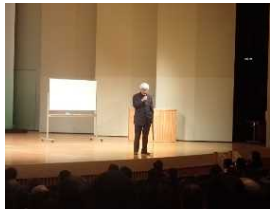
養老孟司先生講演