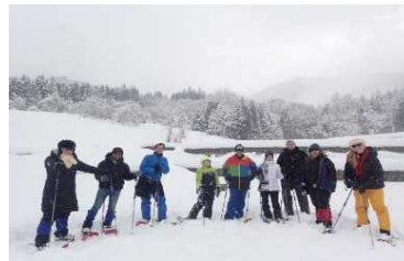
一般モニターツアー