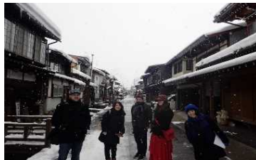
海外エイジェントモニターツアー