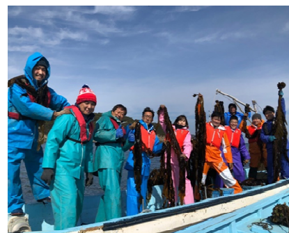
東京より4名のモニターを招聘し、ワカメ収穫等のモニターツアーを実施