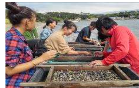
インターンシップを受け入れアサリの選別作業等の体験により、渚泊への理解促進