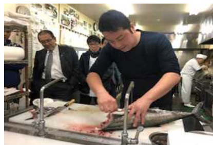
料理人によるトロさわらの料理レシピの実演と、関係者との意見交換