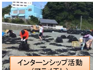
インターンシップ活動 (アラメ干し)