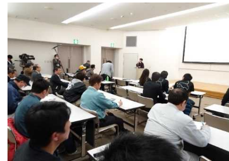
ブランド化されたトロさわらの活用・展開についてワークショップを開催