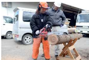
チェーンソー講習