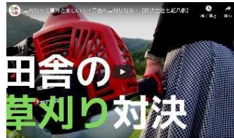
YOUTUBE動画の企画・作成