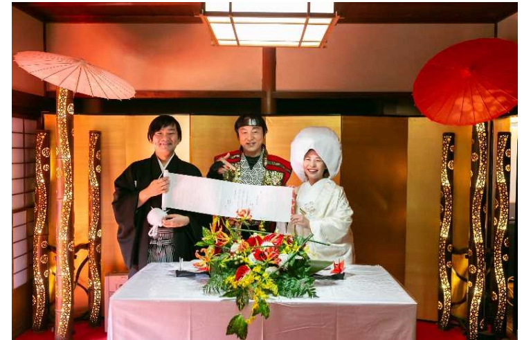
結婚式 新郎新婦と伊賀市長との記念撮影