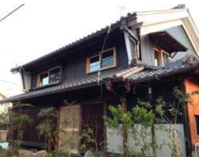
古民家の一棟貸宿