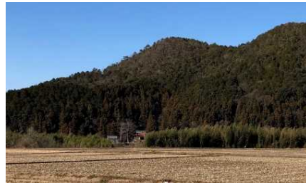
広域連携による農業体験