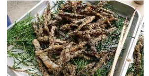
農村料理体験(どじょうのから揚げ)