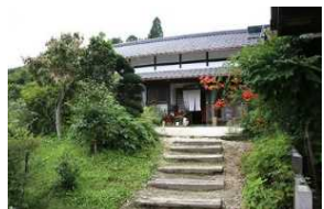
食事・宿泊提供 (いろいろ庵)