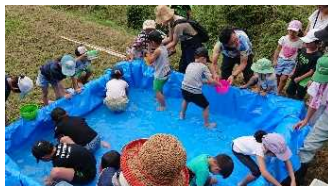
どじょうつかみ体験