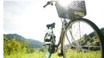
二次交通対策・アシスト付き自転車