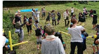
山城合戦チャンバラ体験