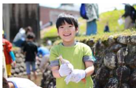
魚つかみ料理体験