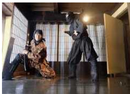
伊賀流忍者博物館