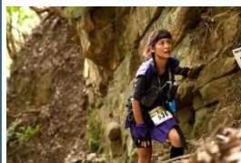
忍者トレイルランニング