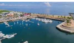
伊勢湾最大級の マリナー