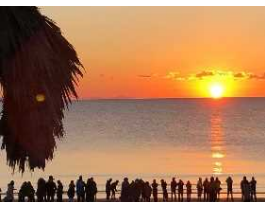
水平線から 昇る朝日