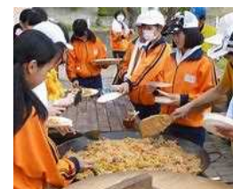
パエリアづくり体験