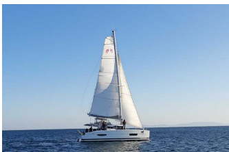
チャータークルーズ