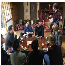
伊勢本街道節句体験