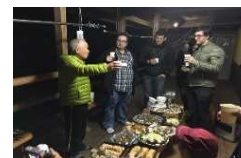
林家民宿ほたるの宿