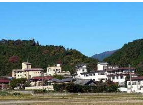
榊原温泉街の風景