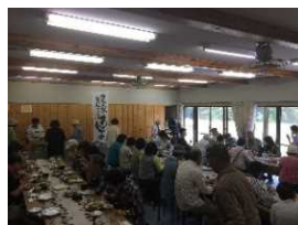
農家レストランまんま