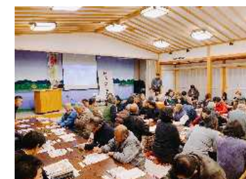
地域住民における「地域の農を守る会」