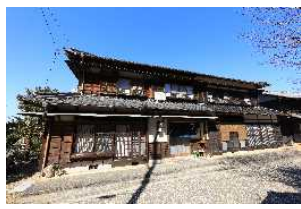
馬籠地域の宿泊施設