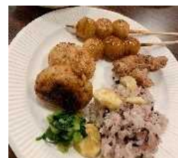
馬籠の食材を使用したメニューの試作品