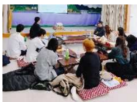
名古屋の学生も交えた地域会議