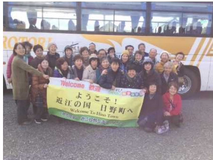
先進地への民泊体験