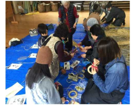
先進地視察 新潟研修