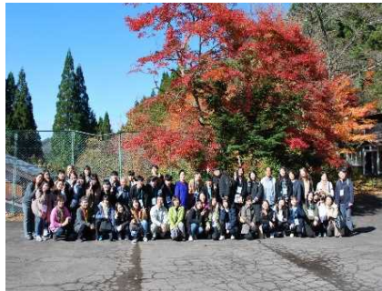
韓国青少年訪日団受入 (初めてのインバウンド事業)