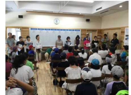
港区青山郡上交流事業