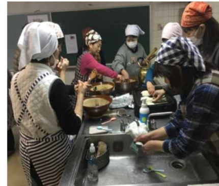
もの作り講座・五平餅づくり講習会