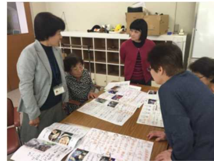
農泊の営業活動・相生地区募集説明会