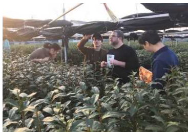
茶摘み体験へのアドバイス