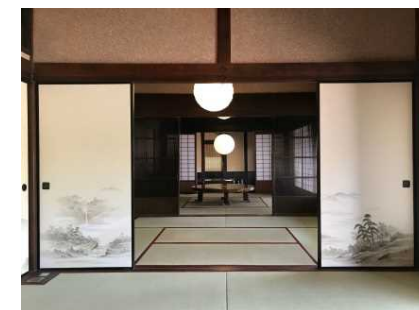
非日常を体験できる宿泊客室