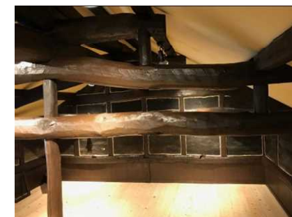
古民家屋根裏の再生