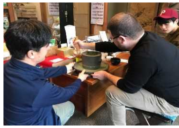
抹茶挽き体験へのアドバイス