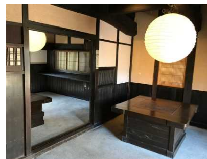
施設内には農家レストラン