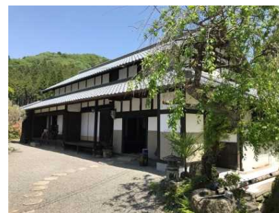
農泊拠点の古民家