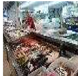
一色さかな広場店内