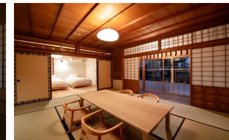
旧松久邸 主屋客室(古民家改修)