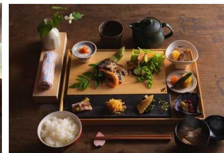
宿泊施設にて提供している朝食