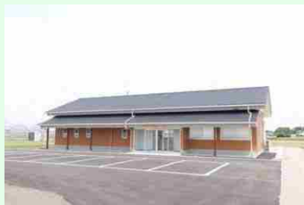
オペレーションセンター