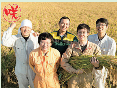
【従業員の皆さん】 （後列中央が尾崎代表）