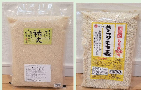
【こだわりの米「祐大」（写真左） と「きらりもち麦」（写真右）】