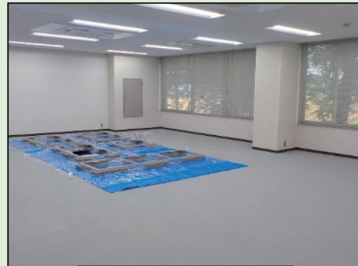
新中央管理所移転先