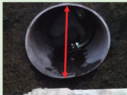
既設管のたわみ状況