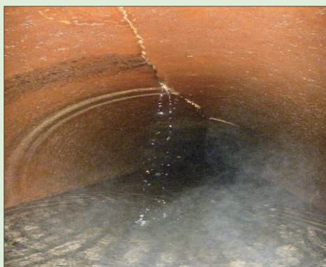
既設管のひび割れ状況