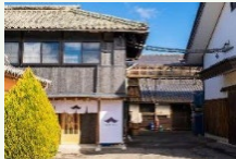
遊休資産を活用した滞在施設の整備