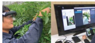
栽培技術のeラーニング