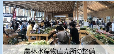
農林水産物直売所の整備