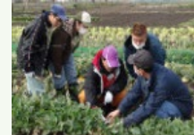
障害者等の農林水産業に関する技術の習得