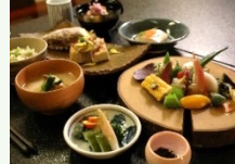
地元食材・景観等を活用した観光コンテンツの造成