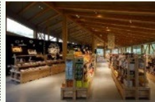
農林水産物販売施設の整備