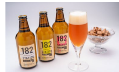
地域資源を活用した商品開発