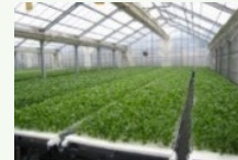
障害者等が作業に携わる生産施設の整備