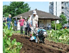
都市農地貸借による担い手づくりへの支援