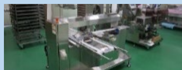
農林水産物処理加工施設の整備