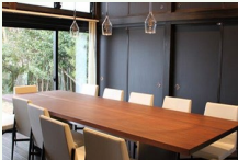
食の高付加価値化に不可欠な内装の改修