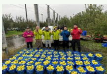
官民共創による地域課題解決