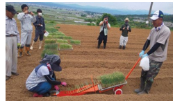
高収益作物の導入