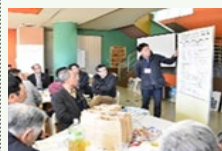
地域活性化のための活動計画づくり※