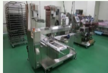
農林水産物処理加工施設の整備