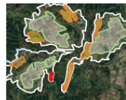
土地利用構想の作成

地域における土地利用構想の作成から実現までの取組や荒廃農地の再生を総合的に支援します。