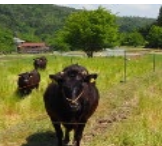
農地の粗放的利用