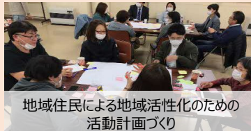
地域住民による地域活性化のための活動計画づくり