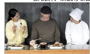
インバウンド向け食コンテンツの造成