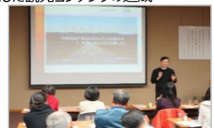
専門家の派遣・指導