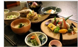
地元食材・景観等を活用した観光コンテンツの造成