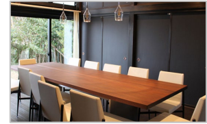
食の高付加価値化に不可欠な内装・遊休資産を活用した施設の整備