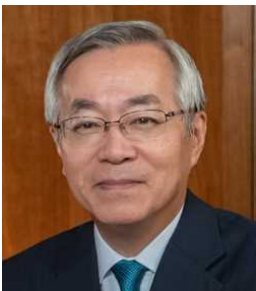
皆川 芳嗣(みながわ よしつ) 林野庁長官、農林水産事務次官などを歴任し、2018年に一般社団法人日本ファームステイ協会副会長理事に就任。