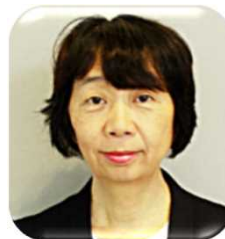
オーガニック ファーマーズ 名古屋 代表

2004年に名古屋市にオアシス21オーガニックファーマーズ朝市村を開設し、新規有機農業就農者の育成と販路開拓に力を注ぐ。NPO法人全国有機農業推進協議会理事、あいち有機農業推進ネットワーク副代表。