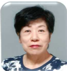
女子栄養大学 名誉教授

30年間岐阜県多治見市で、管理栄養士として学校給食に携わった後、文部科学省学校給食調査官として10年勤務。その後、女子栄養大学短期大学部などを経て、2015年より同大学名誉教授。栄養教諭食育研究会代表幹事、(公財)東京都学校給食会評議員を歴任。