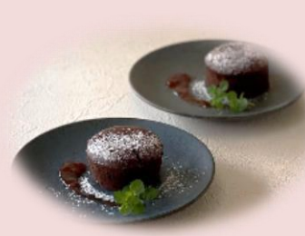
米粉のフォンダンショコラ