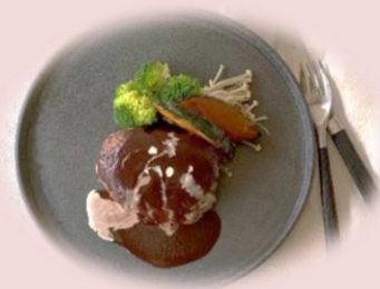
パン粉いらすのハンバーグ