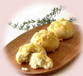
即席米粉チーズパン