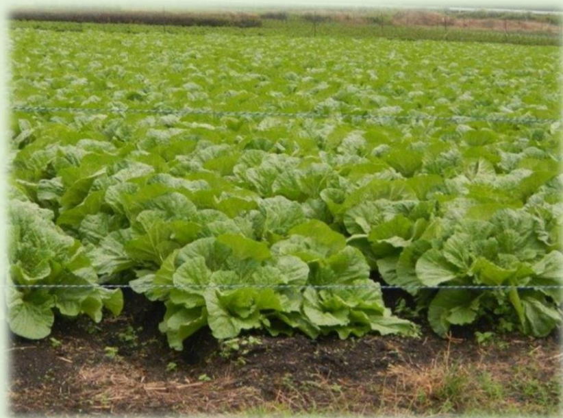
三重県鈴鹿市 はくさい