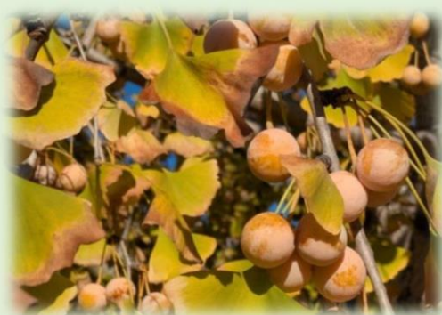
愛知県稲沢市 ぎんなん