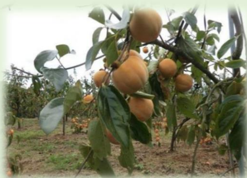
岐阜県美濃加茂市 かき