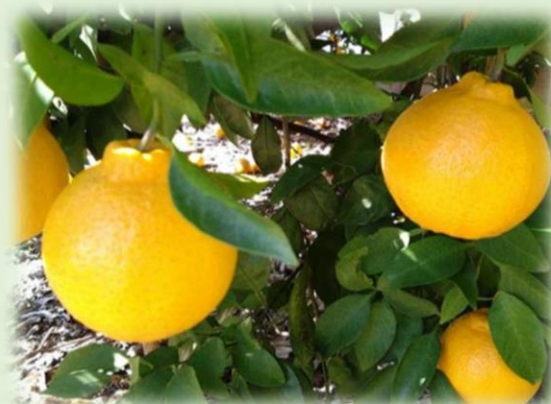
三重県度会郡南伊勢町 不知火