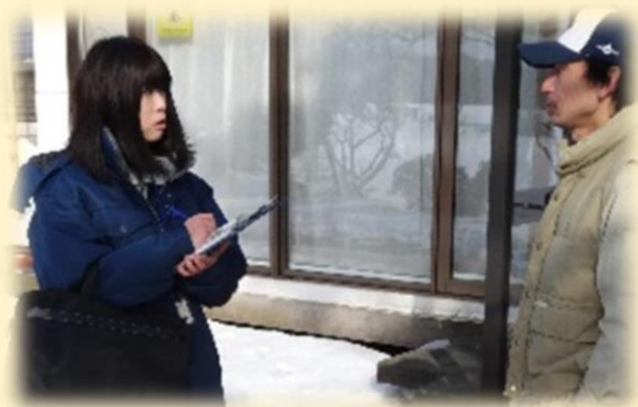
令和8年4月から6月までに実施予定の農林水産統計調査一覧

農林水産統計は、農林水産行政を支える「情報インフラ」及び「公共財」として、食料・農業・農村基本計画等の各種計画に基づく政策目標の設定や評価、国の財政支出の算定根拠、農林水産業の現状の分析などに広く活用されています。