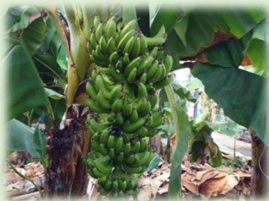
愛知県知多郡美浜町 バナナ