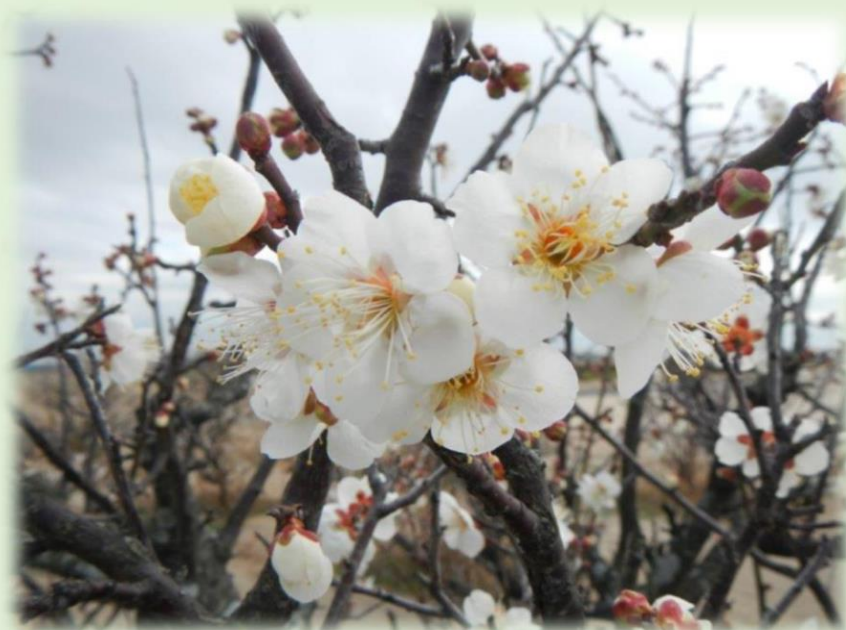
愛知県西尾市 うめ